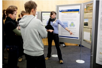
Impressionen der Postersession