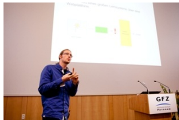
Impressionen der Vorträge